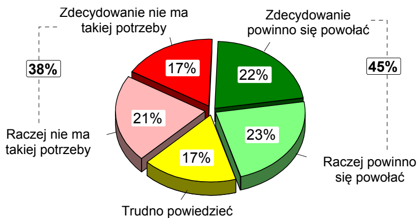
RYS. 3. CZY, PANA(I) ZDANIEM, POWINNO SIĘ POWOŁAĆ SEJMOWĄ KOMISJĘ ŚLEDCZĄ W SPRAWIE DZIAŁAŃ CBA (CENTRALNEGO BIURA ANTYKORUPCYJNEGO), KTÓRE DOPROWADZIŁY DO DYMISJI ANDRZEJA LEPPERA Z FUNKCJI WICEPREMIERA I MINISTRA ROLNICTWA, CZY TEŻ NIE MA TAKIEJ POTRZEBY?

Za powołaniem specjalnej komisji w tej sprawie opowiadają się przede wszystkim zadeklarowani sympatycy LiS (63%), a także wyborcy niezdecydowani, którym być może tego rodzaju śledztwo ułatwiłoby wybór (52%). Mniej stanowczo za utworzeniem komisji śledczej w tej sprawie optują wyborcy PO (51%), przy czym spora liczba zwolenników tego ugrupowania (41%) uważa, że powoływanie kolejnej komisji parlamentarnej nie jest potrzebne. Wśród wyborców LiD połowa (51%) sądzi, że tworzenie takiej komisji jest zbyteczne, a nieco mniej (45%) chciałoby jej powołania. Najbardziej zdecydowanymi przeciwnikami tworzenia komisji w tej sprawie są zadeklarowani wyborcy PiS (56% głosów sprzeciwu), jednak także wśród nich ponad jedna trzecia (36%) chciałaby, aby posłowie śledczy wyjaśnili wszystkie okoliczności akcji CBA w Ministerstwie Rolnictwa.